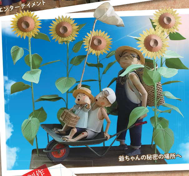
爺ちゃんの秘密の場所へ