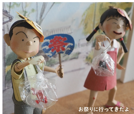
お祭りに行ってきたよ