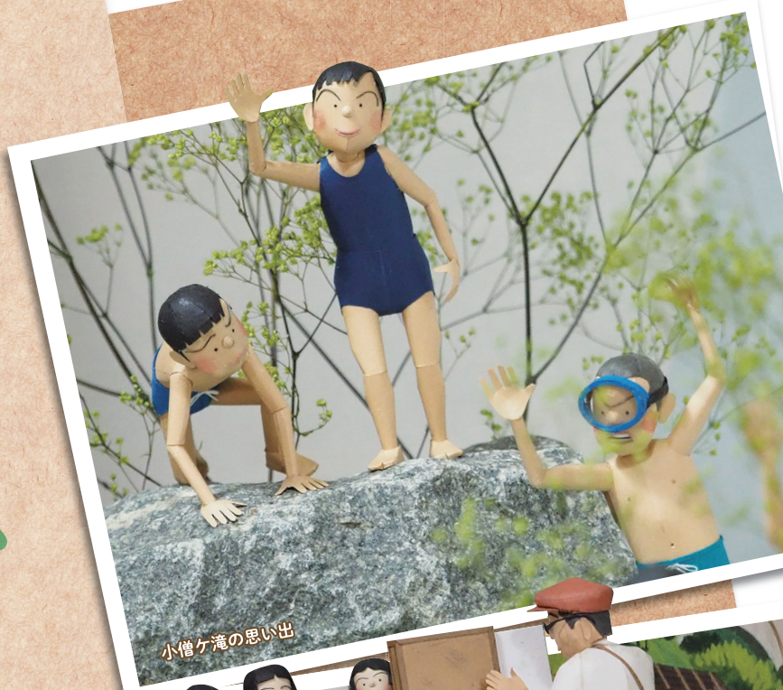
小僧ヶ滝の思い出