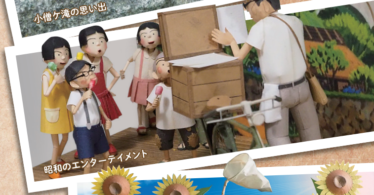
昭和のエンターテイメント